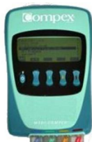
MEDICOMPEX Ripristino del tono muscolare

La terapia fisica si addice a parecchie condizioni patologiche principalmente a quelle ad andamento cronico.