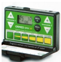
ELETTROANALGESIA EMPI MODELLO EPIX Mialgie, nevralgie, mal di testa